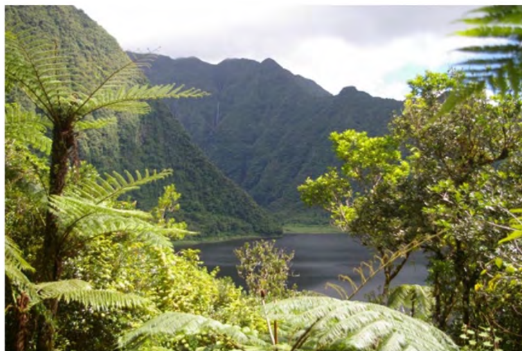
Grand Étang.

Le Grand Étang est un site exceptionnel de La Réunion, c'est le seul lac d'altitude et le plus grand plan d'eau naturel de La Réunion.