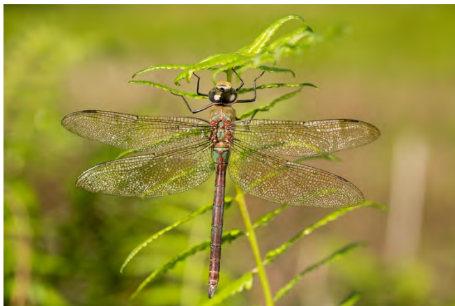
Anax imperator.

On peut citer les libellules et demoiselles indigènes qui sont inféodées à l'eau pour la phase larvaire et à la végétation basse comme support pour émergence des adultes.