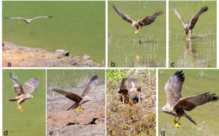
Figure 2. – Circus maillardi : deuxième observation de capture et de dégustation de Carassius auratus (Linnaeus, 1758) (11 h 55) ; 2a à 2f : présence d'un Tilapia sp. de couleur foncée dans les serres du rapace.

Ce site est aussi reconnu comme le seul site où le papangue, rapace endémique de La Réunion ( Circus Maillardi ), espèce protégée par arrêté ministériel du 17 février 1989, a été observé pêchant dans le plan d'eau :